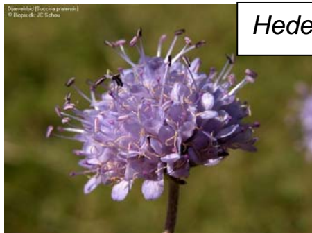
Hedepletvinge – djævelsbid er værtsplante

På hederne findes den sjældne sommerfugl Hedepletvinge. Den findes nu kun enkelte steder i Danmark på fugtige heder og enge. Den lægger æg på planter af djævelsbid. Hedepletvinge er fredet og må ikke indsamles.