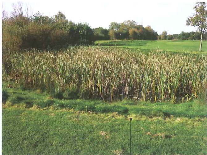
Figur 2: Et vandhul fuldstændig tilgroet med bredbladet dunhammer. Her er intet andet liv, da der ikke er plads til andre planter og vandet er alt for skygget til vandhulsdyr.

de underjordiske hule stængler til rødderne i det iltfrie mudder. Det luftfyldte hulrum er imidlertid også angrebsstedet ved bekæmpelse af dunhammer (se senere).