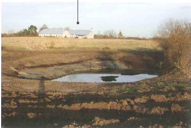
Figur 3: Nygravet vandhul – her ventes spændt på at vandstanden stiger og at det bliver invaderet af mange planter og dyr.

Da dunhammer vokser næringsrigt, har den også en stor produktion af biomasse . Det medfører store mængder af visne blade, der har flere uheldige effekter på dyre- og plantelivet i vandhullet: De skygger for forårets sollys, så vandet nedenunder ikke varmes op. Det er til stor skade for f.eks. padder, hvis æg og haletudser kræver solbeskinnet, varmt vand. De visne blade er lyse og reflekterer derfor en del af sollyset. Også dette hæmmer opvarmning af vandet. De store bladmængder kvæler alle andre planter, der måtte forsøge at etablere sig på stedet. Endelig, så nedbrydes de visne blade, hvorved vandets ilt bruges, og der frigøres næringsstoffer, dvs. at en meget uheldig cyklus er opstået.