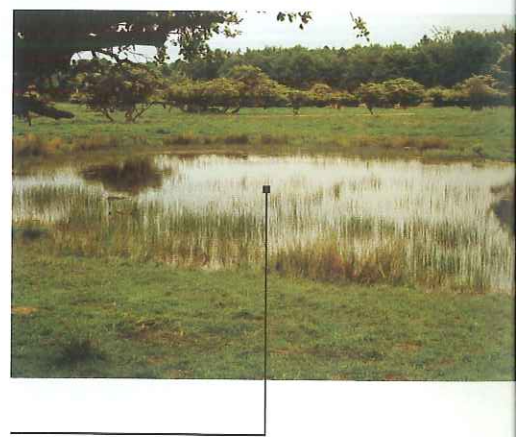
Figur 1: Et korrekt pleje vandhul med plads til kantvegetation og vandplanter. Her er sol og varme til stor vandsalamander og vandinsekter.

Da dunhammer frø spirer villigt på blottede mudderflader er især nygravede vandhuller med bare