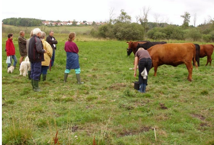
Dyrene beundres af medlemmer

Frivillige plejer også natur med høslæt i delområder med arter, som har brug for særlig pleje, f.eks. engblomme